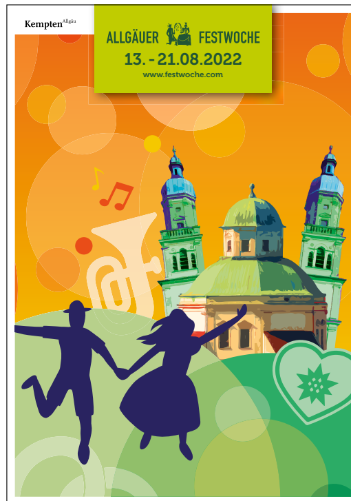
Imageplakate DIN A3 und DIN A1