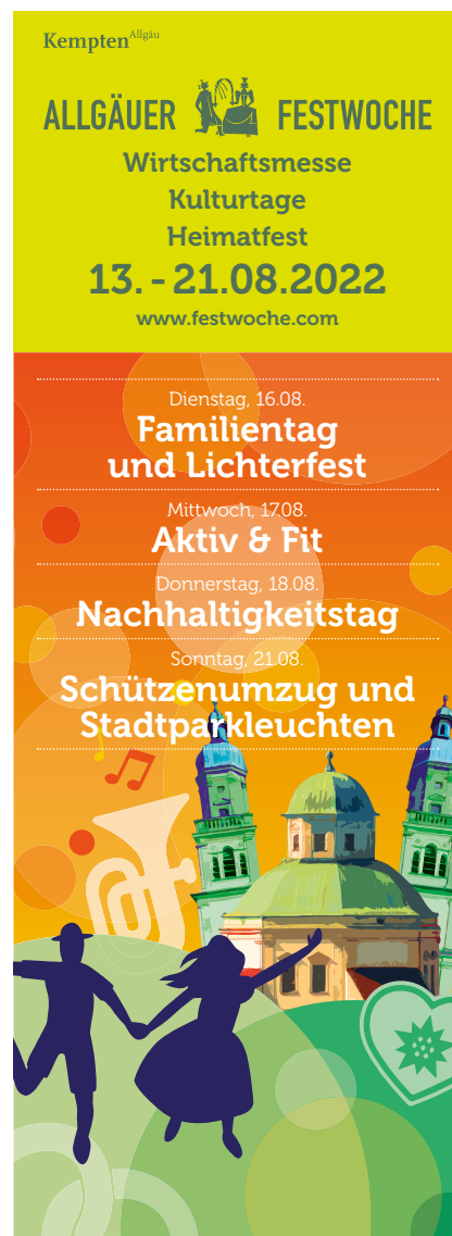
Imageinseration 92 x 260 mm