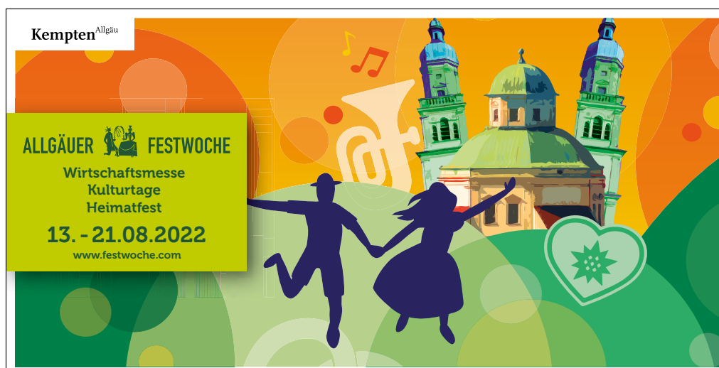
Banner für Bauzäune 3400 x 1730 mm