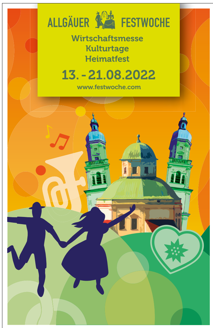
Imageinseration 92 x 141 mm