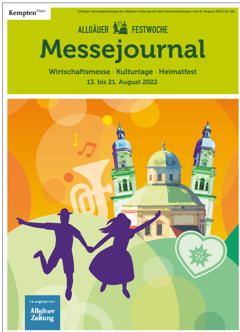
Titelseite Messejournal 243 x 335 mm

Der Titel des Messejournals hat eine Sonderstellung inne. Hier erfolgt die Wiedergabe des Key-Visuals losgelöst in einem quadratischen Ausschnitt unterhalb des Headers. Dieser wiederum beinhaltet Wort- & Bildmarke nebst Ergänzungen.